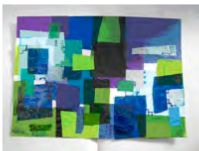
Kolore hotzekin bakarrik