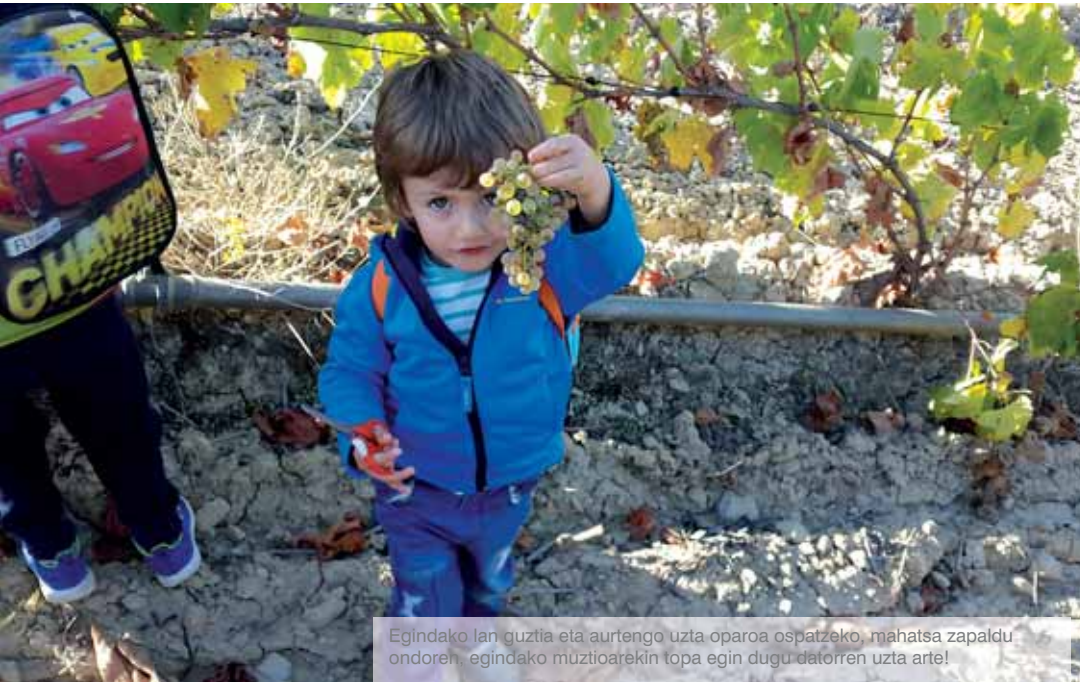
Egindako lan guztia eta aurtengo uzta oparoa ospatzeko, mahatsa zapaldu ondoren, egindako muztioarekin topa egin dugu datorren uzta arte!