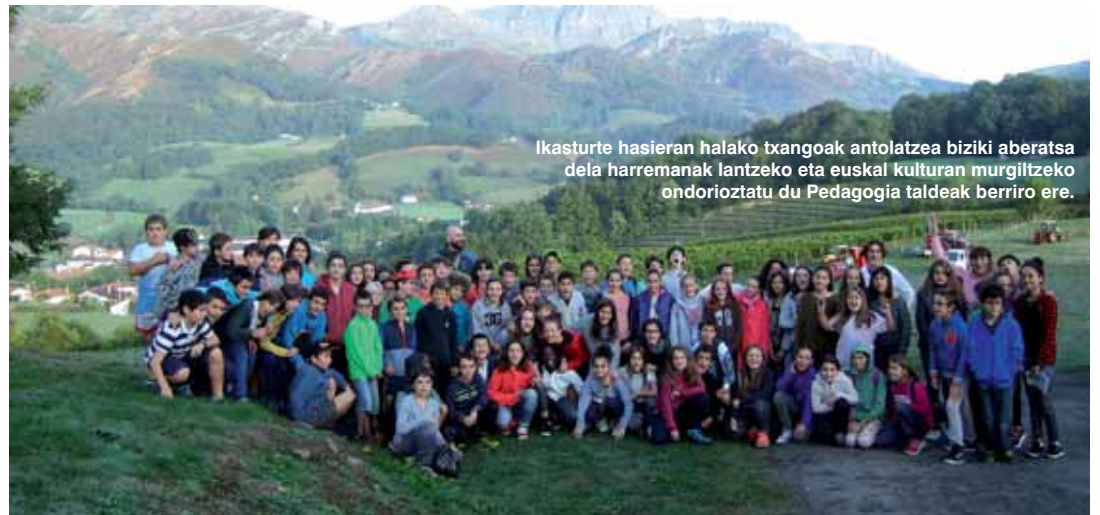
Ikasturte hasieran halako txangoak antolatzea biziki aberatsa dela harremanak lantzeko eta euskal kulturaren murgiltzeko ondorioztatu du Pedagogia taldeak berriro ere.

Ikasturte hasieran proposatu zen txangoa seigarren mailakoentzat Baigorriko Oronozia aterpean euskal giroan jarduteko, ikasleak elkar hobeki ezagutzeko ikastola ezberdinetatik heldu baitira guztiak. Mitologian, musikan, artean, zineman eta herri kiroletan aritzeaz gain, talde txikitan banatuta, lau tailer ezberdinetan parte hartu dute bideoa, musika, gasna eta esku-lanak lantzen. Jolasak eta elkarkidetzak garrantzi handia izan dute, motibatuta izan baitira, hartu-eman azkarrak hazteko. •