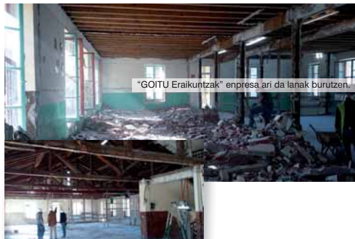
“GOITU Eraikuntzak” enpresa ari da lanak burutzen.

Sakramentinoetako eraikin nagusian obrak egin ahal izateko ikastola hankaz gora jarri eta infra-egitura moldaketa ugari egin behar izan dute. Lanak aurrera doaz, dagoeneko Gabonetan gaude! Eraikin nagusia hustu behar izan da, Sakramentinoen lokalak alokatu eta horiek prestatu klaseak emateko. Egurrezko etxea berrantolatu, atezainaren etxea zena erabili, DBHko gelak Usabalera aldatu, Udalaren baimenarekin Berazubi estadioa jolastoki bezala erabili, informatika gela teknologiarekin elkartu, jangela zerbitzuak berrantolatu hiru kokapen ezberdinetan, autobusak ere egokitu... zer ez da egin Laskorainen berrikuntza hauek lortzeko: teilatua, fatxada, solairu guztiak berregin eta patioan estalpe berria eregi. 2017ko irailean eraikuntza berrian sartzeko moduan egonen dira. Zorionak antolakuntzari! •