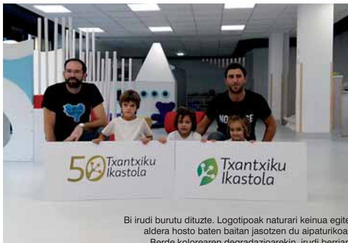
Bi irudi burutu dituzte. Logotipoak naturari keinua egite aldera hosto baten baitan jasotzen du aipaturikoa. Berde kolorearen degradazioarekin, irudi berriari sakontasuna eman nahi izan zaio. Eta urre kolorearekin, urrezko ezteiak.

Ikasturte berezia, betiko gogoratzen, izango da aurtengoa txantxikuentzat, izan ere 50 urte badira Oñatiko ikastola sortu zutela, hezkuntza eredu berritzailean murgilduta daudela eta 2017ko Kilometroak jaia antolatuko dutela. Erroka integrala inondik ere! Horregatik sortu dute logotipo berria, hori guztia biltzen duena. Txantxikuarekin orain arte eduki duten lotura mantenduz, txantxikua bera hartu beharrean, apoaren oinetan oinarritu dira. Txantxikuak hiru edo lau hatz eduki ditzake, baina hirukoa aukeratu dute. “Gure ikastolaren hezkuntza proiektua hiru etapatan banatzen denez, hatz bakoitzarekin etapa bat irudikatu nahi izan dugu. Eta hiru hatzak oin berean jarri gura izan dugu, ikastolaren hezkuntza proiektuak daukan koherentzia eta sekuentziazioa isladatzeko”. •