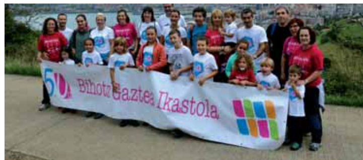
Ikasleek haratago eraman zuten ideia: Zergatik bidali bakarrik ikastoletara, eta ez bidelagun izan ditugun askori eta askori? Askoren erantzuna izan da, oso goxoa eta gertukoia!

Etorri gurekin Altxorra handitzera egitasmoa oso baliotsua izan da guretzat. DBHko irakasleei ideia luzatu, ikasleek gutunak sortu eta Euskal Herriko ikastoletara bidaliko genituen, eskaera erraz batekin: gure 50.urtebetzearen logoa hartu eta nahi zuten argazkia egin zezaten. Izugarria izan da erantzuna: Lehena, Argia Ikastolakoa urrun kilometrotan baina oso gertu bihotzean... San Bizente, Baskonia/Alaves, Tantiurumairu, Hautzarro, Axular Lizeoa, Udaregi, Uzturpe, Txintxirri, Athletic, Enaut Elorrieta, Harrobia, Betiko, Claret Askartza, Asti Leku... eta, konturatu gabe, guztiei esker, altxorra aberastu zen. •