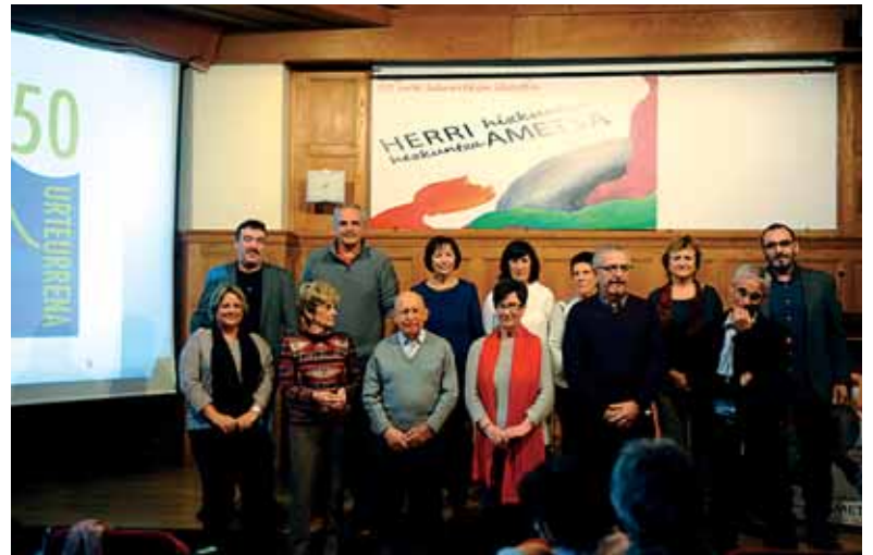
Taula gainera deituak izan ziren ikastolak izan dituen lehendakari eta zuzendaria guztiak esker eta txalo beroak jasotzera. Hunkigarria benetan!