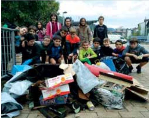
Ordu batzuk horretan eman ondoren, jasotako zabor guztiarekin kontainer bat bete zuten.